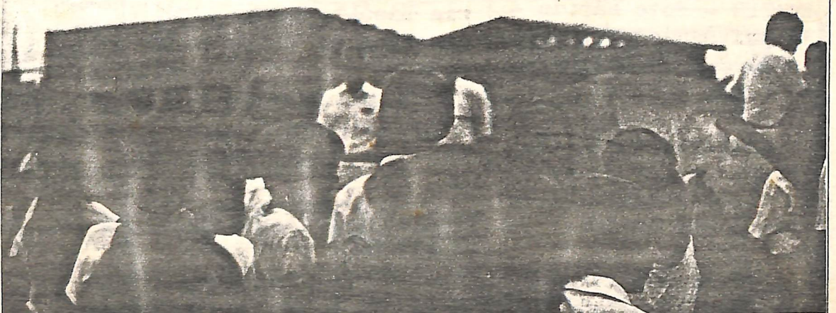
Manifestação de jovens e estudantes em setembro de 1987